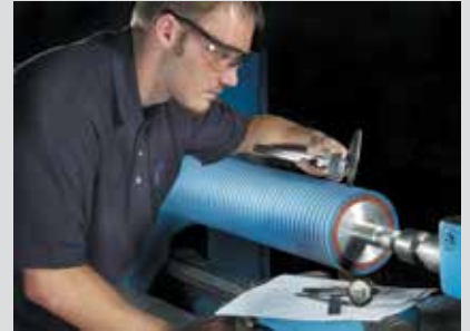
Inspeccion de rodillo